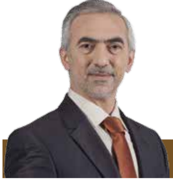
Fazlı KILIÇ Belediye Başkanı

Kıymetli Kağıthaneli komşularım sizleri sevgi ve saygıyla selamlıyorum. Yaptığımız yatırımlarla Kağıthane hızla büyümeye ve gelişmeye devam ediyor. Bu gelişmelerde siz değerli komşularımızın çok çok emeği var. Göreve geldiğimizde ilçemizdeki park ve yeşil alan sayısı 49'du. Şimdi ise bu sayı neredeyse 6 katına çıkardık ve Kağıthane genelinde park sayısını 287'ye ulaştırdık.